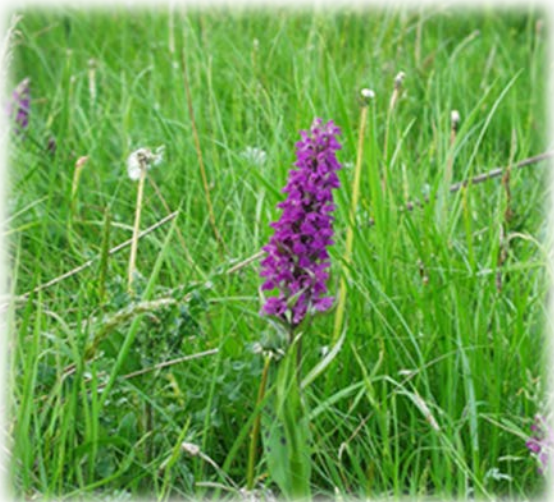
3 | 13. november 2014